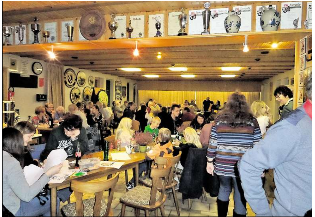
Zahlreiche Interessierte besuchen den Kaffeenachmittag des SV Altmerdingen.

Bereits beim Spätsommerfest 2013 konnten Lose erstanden werden, die für die Verlosung der Ehrenscheibe „25 Jahre Schützenverein Altmerdingen“ wichtig waren. Vier Zahlen kamen in die Endverlosung, die bei einer Sonderziehung am Herbstkaffeenachmittag durch den Ortsbürgermeis-