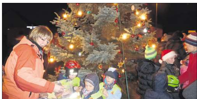
Der lebendige Adventskalender der Ahltener Kindertagesstätten.

Die Eintrittskarten kosten neun Euro und sind ab sofort bei der Sehnder Firma Druckwerk (Mittelstraße), unter den Telefonnummern (0 51 38) 70 82 69 (Müller) und (0 51 38) 88 72 (Sander) sowie bei allen Orchestermusikern erhältlich.