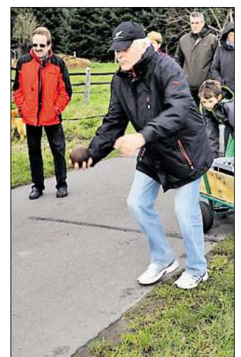
Die Tischtennispieler des TTC Arpke schieben die Boßel-Kugel.